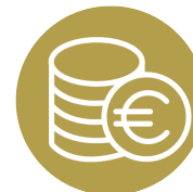
COST EFFECTIVE 经济效益