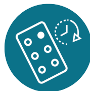
PATIENT ADHERENCE 依从性