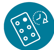
PATIENT ADHERENCE 依从性

该奖项将授予通过创新或改进的包装方案提高患者依从性（不仅限于包装材料、包装设计、给药形式、智能交互）的产品或企业。