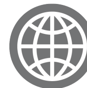
MARKET POTENTIAL 市场潜力