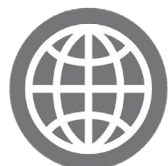
MARKET POTENTIAL 市场潜力

该奖项将授予通过改革或创新方案为制药企业创造药品市场新商机，帮助制药企业引领市场的产品或企业。标准: